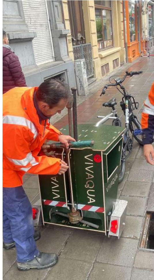
Co-développement d'une remorque compacte et sur-mesure avec Bilmo