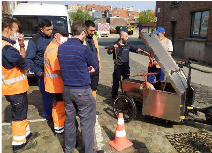
Session de découverte de vélos-cargos et d'analyse des besoins avec le service des hydrants de Vivaqua