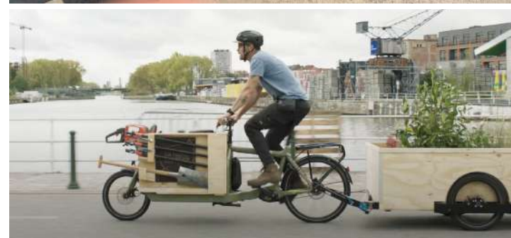
Session de découverte avec les agents du service Propreté publique de la Commune de Jette, pour inaugurer le lancement du programme en interne